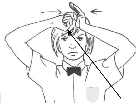
( Geste) Touche appuyée

Ex : Boxeur Coin Rouge, Pénalité (geste = poing fermé avec pouce levé) pour touche trop appuyée ( geste = poing fermé sur une main ouverte ) il aurait fallu intégrer des pictogrammes pour montrer les gestes correspondants aux fautes.